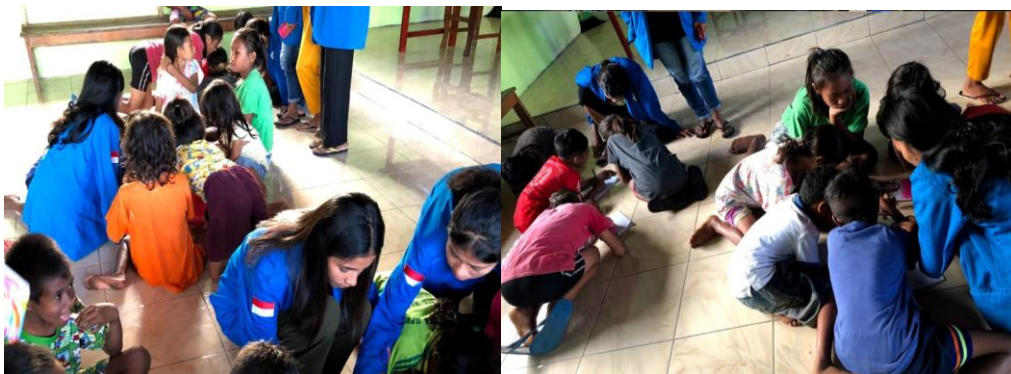
Gambar 2. Bimbingan Belajar

Bimbingan belajar merupakan program unggulan yang dilaksanakan oleh mahasiswa KKN Dusun Upunyor terhadap siswa-siswi SD Kristen Upunyor. Hal ini bertujuan untuk menjawab tantangan rendahnya hasil belajar siswa pada beberapa mata pelajaran terutama pada pelajaran Matematika. Kegiatan bimbingan belajar ini dilaksanakan di luar jam sekolah dan berlokasi di Balai Dusun Upunyor. Proses bimbingan belajar dapat dilihat pada Gambar 2.