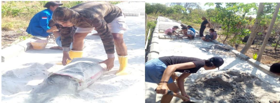
Gambar 5. Program Cetak Batako

Program Cetak Batako merupakan program usulan dari warga dusun yang disampaikan melalui Kepala Dusun Upunyor dalam rapat penyampaian rencana program kerja oleh mahasiswa KKN Dusun Upunyor. Batako yang dicetak merupakan keperluan pembangunan Gereja baru di Dusun Upunyor. Semua bahan yang diperlukan telah disediakan oleh warga Dusun Upunyor. Proses cetak batako oleh mahasiswa KKN dapat dilihat pada Gambar 5.