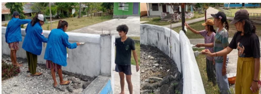
Gambar 4. Pengecatan Pagar Gereja

Program kerja selanjutnya dari mahasiswa KKN Dusun Upunyor adalah pengecatan pagar Gereja. Gereja yang terletak di Dusun Upunyor merupakan tempat ibadah bagi masyarakat Dusun Upunyor maupun masyarakat dari dusun maupun desa lain. Proses pengecatan Gereja dapat dilihat pada Gambar 4.