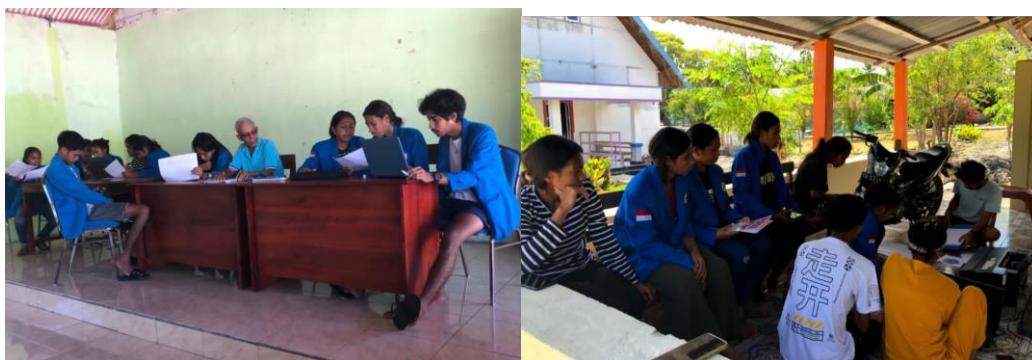
Gambar 6. Melengkapi Administrasi Dusun

Selain cetak batako, program lain yang diusulkan oleh Kepala Dusun Upunyor adalah melengkapi administrasi dusun. Rencanaprogram kerja tersebut disambut baik oleh mahasiswa KKN Dusun Upunyor. Proses melengkapi administrasi dusun dapat dilihat pada Gambar 6.