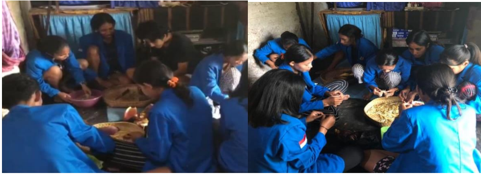
Gambar 1. Pengolahan Bunga Jantung Pisang

Program pengolahan jantung pisang menjadi crispy bunga jantung pisang mendapat respon positif dari masyarakat. Produk yang dihasilkan banyak diminati oleh konsumen. Secara umum konsumen merasa sangat puas terhadap produk yang dihasilkan baik dari segi harga, rasa, maupun tampilah. Oleh karena itu, pengolahan jantung pisang menjadi crispy bunga jantung pisang dapat meningkatkan nilai jual dari jantung pisang yang merupakan hasil pertanian di Dusun Upunyor (Sugiarto, Kamaruddin, et al. 2023).