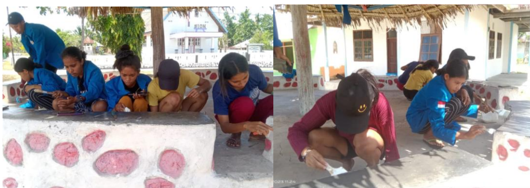
Gambar 3. Renovasi Rumah Payung

Rumah Payung merupakan Gazebo yang terletak di samping Balai Dusun Upunyor. Rumah Payung biasanya digunakan oleh warga dusun terutama para pemuda dan anak-anak untuk duduk santai sambil bercerita. Hasil observasi menunjukkan bahwa kondisi Rumah Payung sudah terlihat usang sehingga memerlukan renovasi. Oleh karena itu, mahasiswa KKN Dusun Upunyor membuat salah satu program kerja merenovasi Rumah Payung. Proses renovasi Rumah Payung dapat dilihat pada Gambar 3.