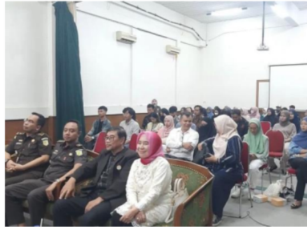
Gambar 2. Proses penyuluhan Anti-Korupsi

Program penyuluhan anti-korupsi yang diinisiasi dalam konteks pengabdian kepada masyarakat bertujuan untuk mendidik dan mendorong masyarakat, khususnya mahasiswa dan tenaga kependidikan, untuk mengadopsi dan mempromosikan praktik integritas dan transparansi di Indonesia (Mansyur et al., 2022). Inisiatif ini datang sebagai respons terhadap situasi korupsi yang mendalam di Indonesia, yang terus menerus menghambat kemajuan ekonomi, sosial, dan politik negara.