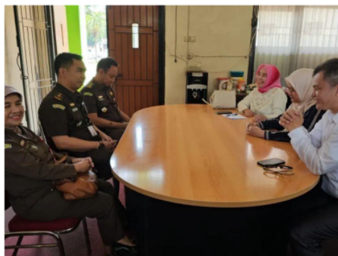
Gambar 1. Koordinasi dengan Kejaksaan Tinggi Jawa Barat untuk pengkoordinir dan management waktu penyuluhan

Secara keseluruhan, penyuluhan anti-korupsi ini tidak hanya telah memperkuat kapasitas individu dalam menghadapi korupsi, tetapi juga secara bertahap mengubah norma dan praktik dalam masyarakat, mendorong pergeseran menuju budaya yang lebih bertanggung jawab dan transparan. Dengan terus memperkuat kolaborasi antar mahasiswa, tenaga kependidikan, dan masyarakat serta dengan dukungan berkelanjutan dari institusi seperti Kejaksaan Tinggi Jawa Barat, program ini berpotensi untuk terus memperluas dampaknya, menjadikan integritas dan transparansi sebagai pilar utama dalam setiap aspek kehidupan masyarakat.