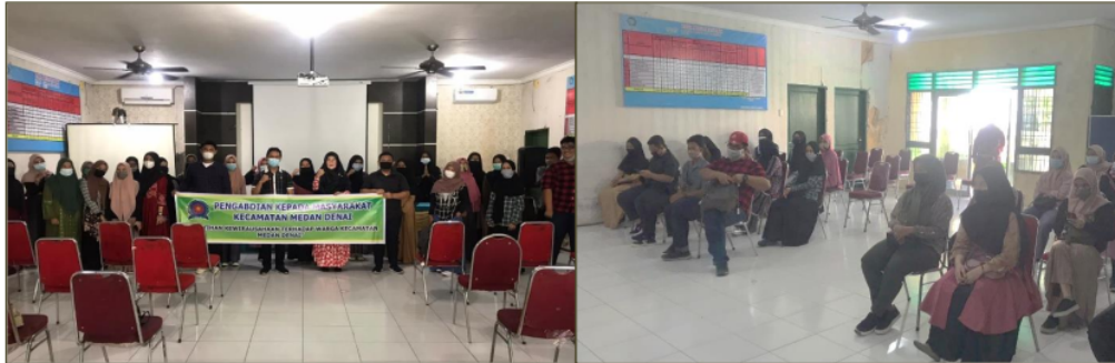
Gambar 3. Sesi Tim Pengabdian Saat Melakukan Ceramah Kegiatan Pengabdian

dapat menciptakan ketaatan diri karyawan baik secara internal perusahaan maupun eksternal dan dapat menjadikan karyawan yang berkarakter, jujur dan memiliki kualitas dalam pelaksanaan kerja dengan tepat waktu