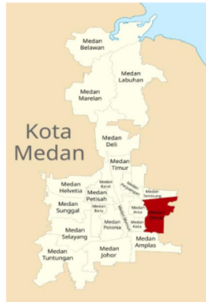
Gambar 1. Peta Lokasi Pengabdian di Kecamatan Medan Denai 1

dikenal dengan nama Perumnas Mandala, yang merupakan singkatan dari "Perumahan Nasional Mandala II Medan". Penduduk yang mendiami kawasan ini merupakan campuran dari berbagai suku. Pada tahun 2021, kecamatan Medan Denai mempunyai penduduk sebesar 169.643 jiwa. Luasnya adalah 9,05 km 2 dan kepadatan penduduknya adalah 18.745 jiwa/km 2 .