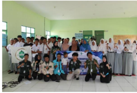
Gambar 3. Foto bersama Peserta Pengenalan Briket Berbahan dasar Sekam Padi.

Pada gambar 2 adalah kegiatan pembuatan Briket dari bahan Sekam Padi bersama warga, dari tahap ini bahan limbah sampah pertanian di olah menjadi Briket yang bisa di manfaatkan di lingkungan sehingga akan mengurangi limbah di masyarakat. Pada kegiatan ini di lakukan pendampingan untuk membuat briket dari bahan Sekam Padi dan menjadi Briket Basah.