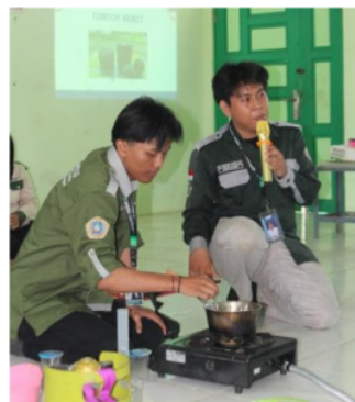
Gambar 2. Pembelajaran Pembuatan Briket bersama Warga