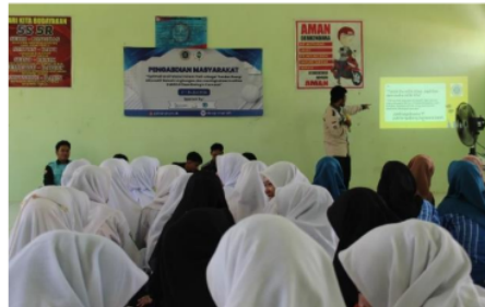
Gambar 1. Penyuluhan Pembuatan briket dan Pemasaran.

Kegiatan Pengabdian Masyarakat ini sudah dilakukan sesuai tahap yang direncanakan dari awal pembuatan briket dari sekam padi. Kegiatan ini dilakukan bersama masyarakat, tim Dosen dan Mahasiswa. Pada Gambar 1 dan Gambar 2 adalah jalannya kegiatan yang dilakukan pada saat pengabdian Masyarakat di Desa Beringin Kencana.