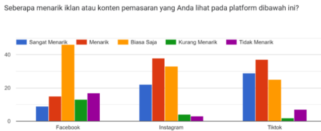
Gambar 2. Tingkat Ketertarikan terhadap Iklan atau Konten Pemasaran di Facebook, Instagram, dan TikTok