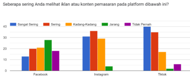
Gambar 1. Frekuensi Paparan Iklan atau Konten Pemasaran di Facebook, Instagram, dan TikTok