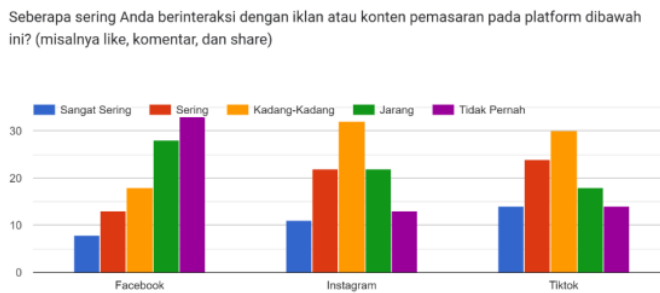
Gambar 3. Frekuensi Interaksi Pengguna dengan Iklan atau Konten Pemasaran di Facebook, Instagram, dan TikTok

Hasil menunjukkan bahwa instagram dan tiktok lebih efektif dalam menarik perhatian dan partisipasi Generasi Z dibandingkan Facebook. Instagram memiliki tingkat keterlibatan tertinggi yang sering berinteraksi dengan konten pemasaran, diikuti oleh tiktok. Facebook menunjukkan efektivitas yang lebih rendah sering berinteraksi dengan platform instagram dan tiktok. Ini menunjukkan bahwa konten video pendek yang interaktif dan kreatif serta konten visual instagram dan tiktok lebih menarik bagi Generasi Z dibandingkan konten di Facebook.