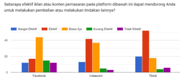
Gambar 6. Keefektifan Media Sosial

Berdasarkan hasil kuisisioner, strategi digital marketing yang paling efektif untuk meningkatkan engagement dan konversi di kalangan Generasi Z adalah sebagai berikut: