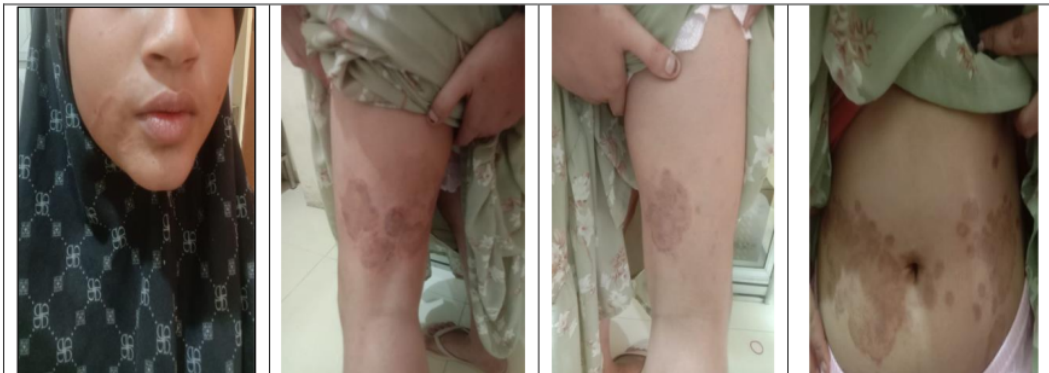
Gambar 1 Dokumentasi awal berobat pada 21 Agustus 2023

Berdasarkan terapinya, terapi non medikamentosanya adalah pasien di edukasikan mengenai bagaimana personal hygiene, hindari aktivitas yang menyebabkan keringat berlebih sehingga rasa gatal yang hebat dapat dihindari, jangan saling meminjam maupun menggunakan fasilitas dan barang pribadi milik orang lain (kawan) seperti pakaian, handuk, mukena, tempat tidur selain milik sendiri agar menghindari penularan infeksi. Pada terapi medikamentosa diberikan obat Itraconazole 1x100mg, Cetirizine 1x10mg dan obat topikal Miconazole cream 2%.