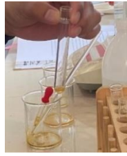
Gambar 3. Sampel sediaan masker peel off ekstrak gambir dan daun pepaya sebelum ditambahkan preaksi