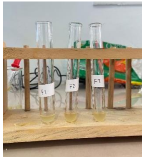
Gambar 4. Sampel sediaan masker peel off ekstrak gambir dan daun pepaya setelah ditambahkan preaksi

Dari gambar diatas dapat dijelaskan bahwa setelah ditambahkan preaksimayer sampel F1(3 gr), F2 (5 gr) dan F3(7%) terdapat gumpulan putih yang menandakan sediaan masker tersebut terdapat kandungan alkaloid.