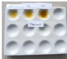
Gambar 1. Sampel sediaan masker peel off ekstrak gambir dan daun papaya sebelum ditambahkan preaksi

Uji flavonoid dilakukan dengan cara 1-2 tetes lapisan air diteteskan pada plattetes kemudian ditambahkan serbuk MG dan HCL (p). Flavonoid positif jika terbentuk warna merah.