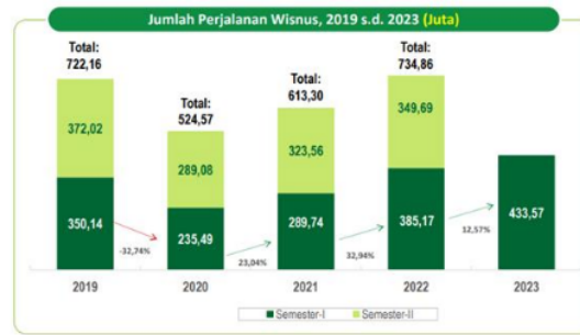
Gambar 1.1 Jumlah Perjalanan Wisatawan Nusantara