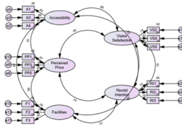
Gambar 4. 2 Uji Pengukuran Setelah Modifikasi