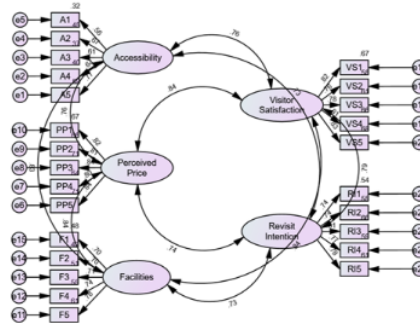
Gambar 4. 1 Uji Pengukuran Sebelum Modifikasi